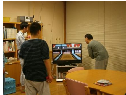
みんなでゲームをしています。