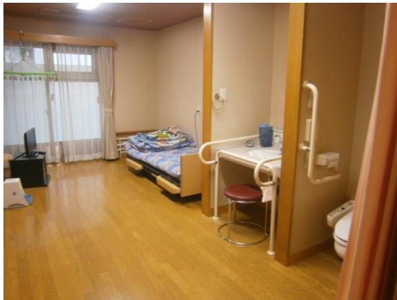
2床あります。毎日2人までご利用いただけます。